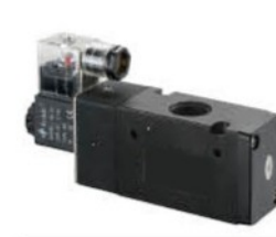
Model: V3241-10 V3241-15