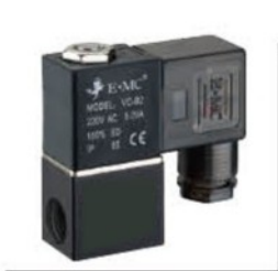
Model: V221-06 V221-08