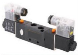
Model: V3222-06 V3222-08 V3232-08 V3232-10