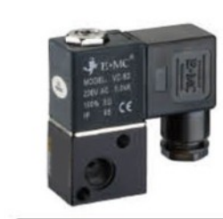
Model: V321-M5 V321-06