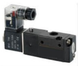
Model: V3211-M5 V3211-06