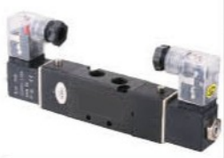
Model: V3212-M5 V3212-06