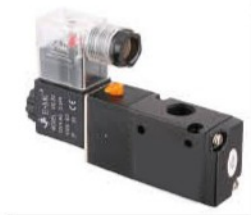
Model: V3221-06 V3221-08 V3231-08 V3231-10