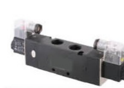
Model: V3242-10 V3242-15